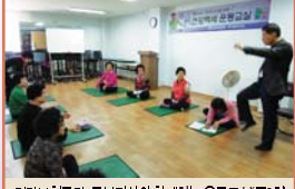
건강보합공단 동부지사와 함께하는 운동교실(주회)