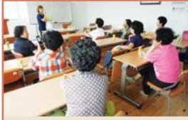
어르신봉사단 상반기 평가회(8.30)