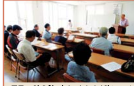
동구노인대학 리더 정기간담회(9.11)