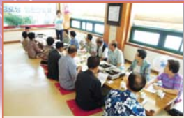
경로당 임원 상반기 간담회(7.12)