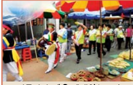
전통시장 애용 캠페인(9.10)