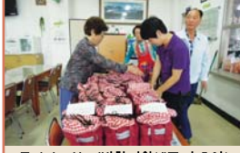
독거어르신 밀반찬지원매주 수요일