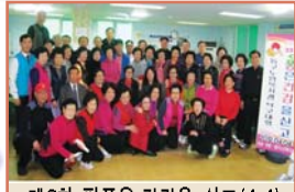
제8회 핑퐁은 건강을 싣고(4.4)