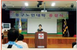
동구노인대학 1학기 종강식(7.27)