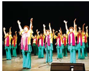
일 시 : 2012. 5. 30(수) 대회명 : 어르신여능경연대회 참가팀 : 동구실버합창반 등 위 : 대상