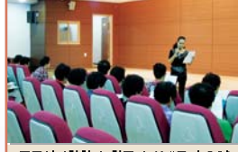
동구실버합창단 활동장면(매주 수요일)