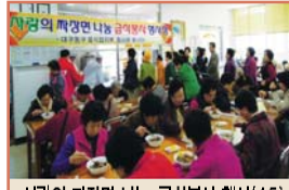
사랑의 자장면 나눔 급식봉사 행사(4.5)