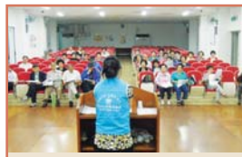
노인일자리 교육형 보수교육(5.25)