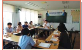
직원내부교육 - 사례관리(7.25)