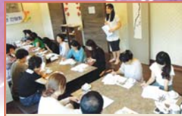
노인일자리 교육형 수요처간담회(7.17)