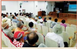
노인일자리 공익형 보수교육(7.27)