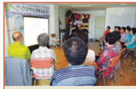
노인성 질환 관리교육(5.16)