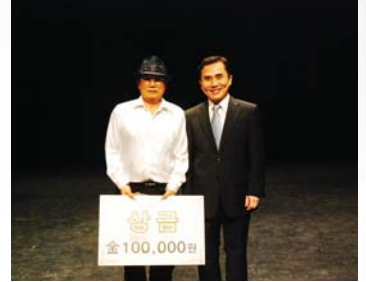
일 시 : 2012. 5. 30(수) 대회명 : 토토시니어댄스페스티벌 참가팀 : 동구실버댄스스포츠반 등 위 : 화목상