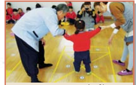
어르신강사 - 전통문화체험(4.27)