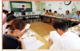
동구노인대학 1학기 강사간담회(7.27)