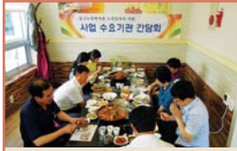
노인일자리 공익형 수요처간담회(7.19)