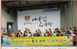
불로전통시장 재능나눔 봉사단 공연(9.10)