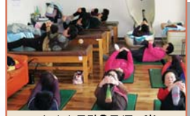
술관절 근력운동(주 3회)