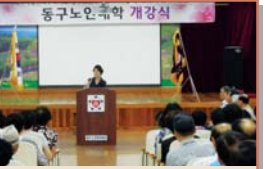
동구노인대학 2학기 개강식(8.20)