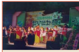
2012년 대구광역시 한방문화축제 (년타)(5.3)