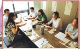
노인일자리 복지형 수요처간담회(7.18)