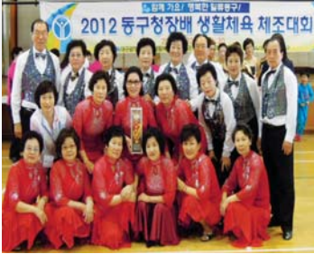
일 시 : 2012. 4. 22(일) 대회명 : 2012.동구청장기 생활체육 체조대회 참가팀 : 동구실버사교댄스반 등 위 : 최우수상