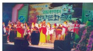
5.3 약령시 한방문화축제