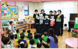
어르신강사 - 성교육인형극(7.6)