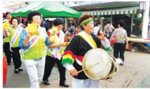
전통시장 애용 가두캠페인