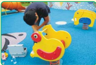
<세균수 측정 장면>

무심결에 만지는 공공 시설물에 많은 세균이 있다는 사실 다들 알고 있지만 만지지 않을 수도 없고 다 닦을 수도 없는 노릇인데요. 이러한 공공 시설물을 어르신들이 직접 만든 친환경 EM세제로 클린도우미 어르신들이 소독 청소를 정기적으로 실시하고 있습니다. 소독 전후를 측정한 결과 세균수가 90%가량 감소되었고 친환경 세제이기에 더욱 믿을 수 있습니다. 아이들이 뛰어 노는 놀이터와 남녀노소 할 것 없이 누구나 사용하는 운동기구!! 이제 믿고 사용하세요^^