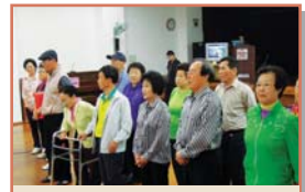
부부의 날 기념행사(5.21)