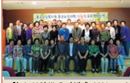
2학기 신입생 오리엔테이션(9.20)