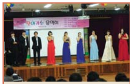
어머님과 함께 하는 문화이벤트(5.24)