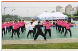
동구청장기 생활체육 국학기공대회(4.29)