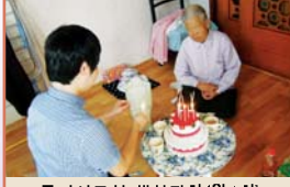
독거어르신 생신잔치(월 1회)