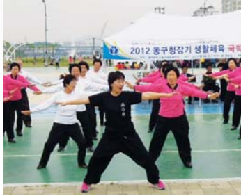
일 시 : 2012. 4. 29(일) 대회명 : 2012.동구청장기 생활 체육국학기공대회 참가팀 : 동구실버국학기공반 등 위 : 우승