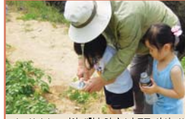
어르신강사 - 자연 체험수업 <김자 물주기>(수시)