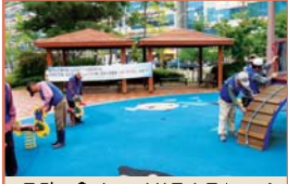
클린도우미 - 시설물소독(9.14)