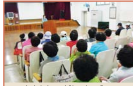
노인일자리 복지형 보수교육(4.27)