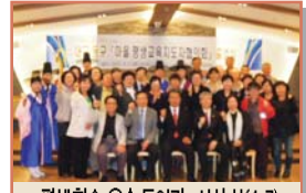
평생학습 우수 동아리 시상식(4.7)