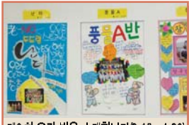
제6회 우리 반을 소개합니다(3.12~4.30)