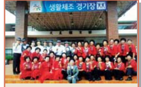
전국 어르신 생활체육 생활 체조대 회(9.12~13)