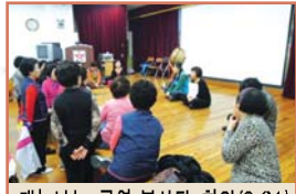
재능나눔 공연 봉사단 회의(3.21)