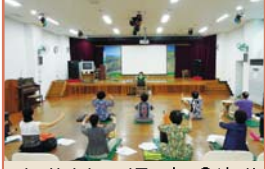
어르신강사 - 장구보수교육(수시)