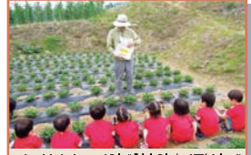
어르신강사 - 자연체험수업 <명궁>(수시)