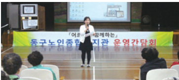
4.1 상반기 운영간담회