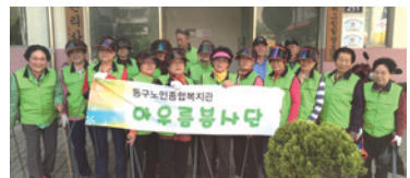
4.29 아우름봉사단 봉사활동