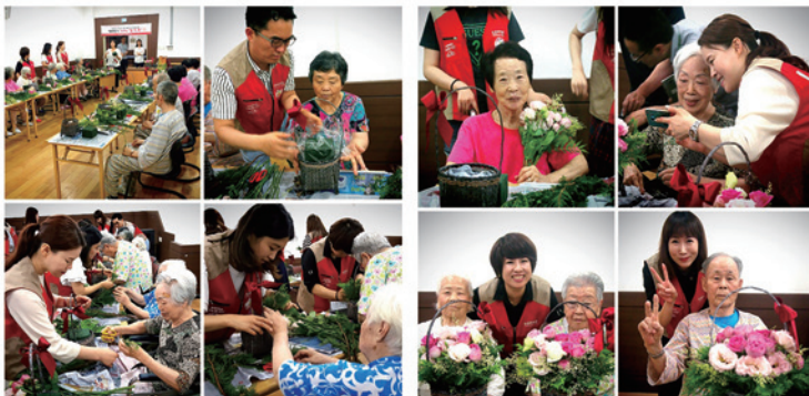
3회차 “나만의 꽃 바구니 만들기”