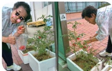
원예프로그램-나만의 텃밭 가꾸기