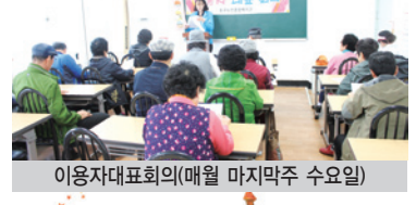
이용자대표회의(매월 마지막주 수요일)