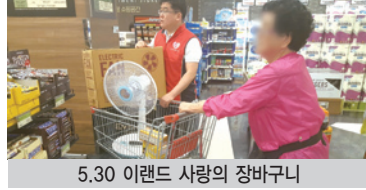
5.30 이랜드 사랑의 장바구니