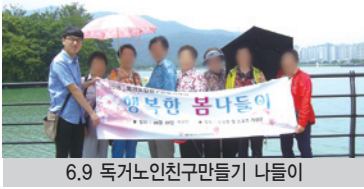
6.9 독거노인친구만들기 나들이