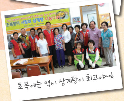
초복에는 역시 삼계탕이 최고야~