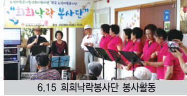
6.15 희희낙락봉사단 봉사활동