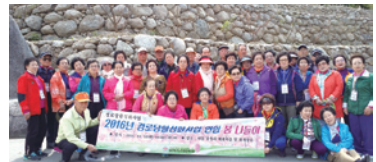
4.12 경로당연합 나들이