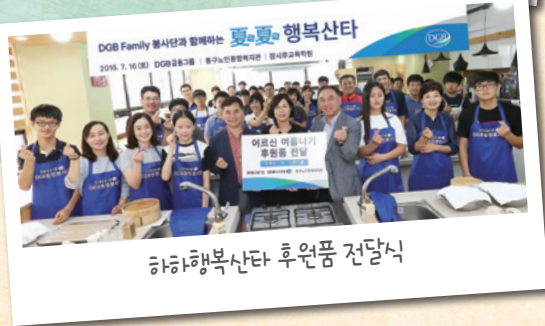
하하행복산타 후원품 전달식