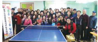
3.23 제12회 핑퐁은 건강을 싣고