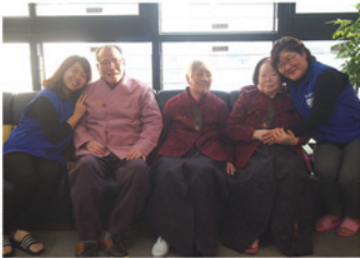
거주 어르신 의복지원