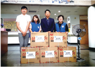
생활실내 선풍기 지원