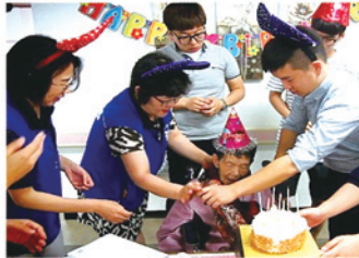
거주 어르신 생신잔치 지원