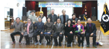
2.26 학생회 이취임식