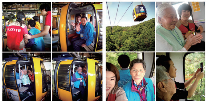
2회차 “신나는 팔공산 케이블카 체험”