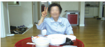
5.19 독거노인친구만들기 사례관리