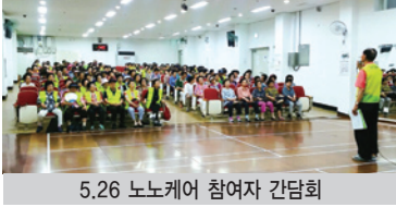
5.26 노노케어 참여자 간담회