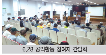
6.28 공익활동 참여자 간담회