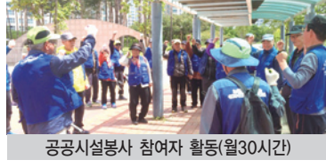
공공시설봉사 참여자 활동(월30시간)