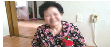
5.2 효사랑 카네이션