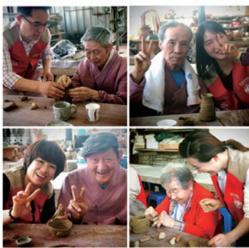
1회차 “나만의 도자기 만들기”