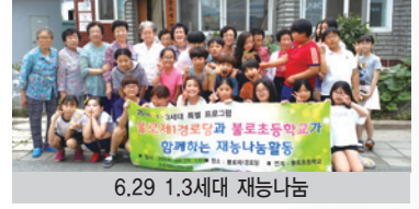
6.29 1.3세대 재능나눔