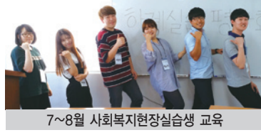
7~8월 사회복지현장실습생 교육