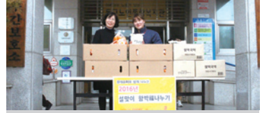
2.4 설맞이 함박복나누기(롯데슈퍼 지저점)