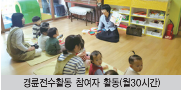
경륜전수활동 참여자 활동(월30시간)