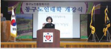
2.1 1학기 개강식