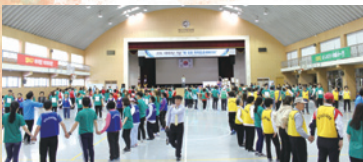
5.4 제12회 하하호호체육대회