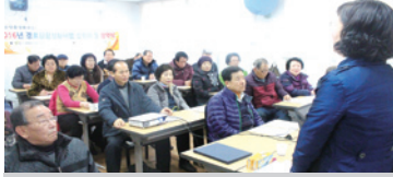
2.2 경로당 사업설명회 및 협약식