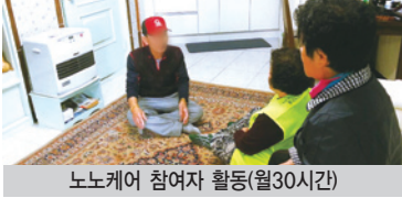
노노케어 참여자 활동(월30시간)