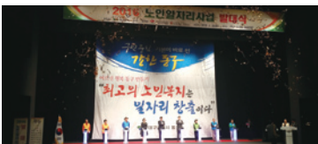
4.19 노인일자리사업 통합발대식