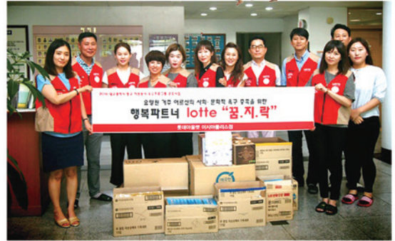
“후원금” 및 거주 어르신 “생필품” 지원