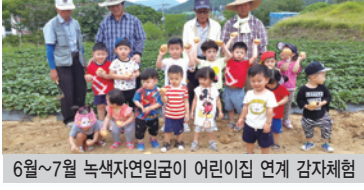
6월~7월 녹색자연일군이 어린이집 연계 감사체험