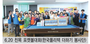
6.20 친목 포켓볼대회(한국폴리텍 더하기 봉사단)