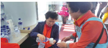
4.19 장검다리봉사단 봉사활동