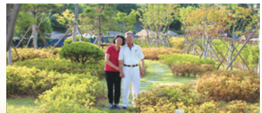
5.20 부부의날 이벤트