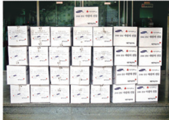
거주 어르신 식료품 지원