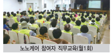
노노케어 참여자 직무교육(월1회)