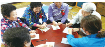
5.2 세대공감 러브레터