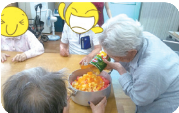
특별프로그램-새콤달콤 화채 만들기