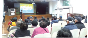
3.3 공익활동 참여자 사전교육