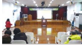
2.11 경로당활성화사업 설명회