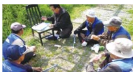
4~6월 일자리사업 모니터링