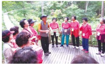
② 오감만족 숲체험(산책)