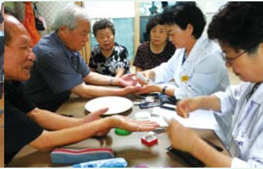
▲ 수지침 프로그램