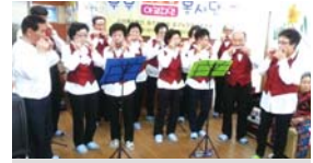
허모내반 진명 2인센터 공연매월셋째주 수요일