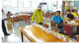
6.18 세대공감프로젝트 '1070만남'