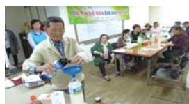
4.18 지역주민대상 EM활용교육