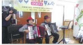
부부봉단 진명 2인센터공연매월셋째주 수요일