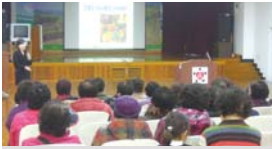
2.17~28 일자리 사전교육