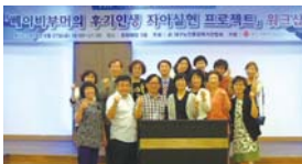
6.27 도시농부학교 워크샵