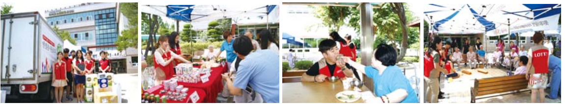
▲ 마이홈특화프로그램인 행복장터에 지역사회연계 기관으로 참여하며 열심히 활동 중인 모습들 ♪