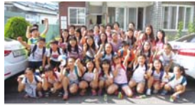
6.24 1.3세대교과 불로초&불로경로당 재능-농협동