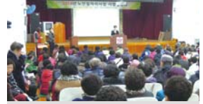
2.11 노인일자리사업 설명회