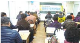
3.12 경로당 상반기 임원간담회