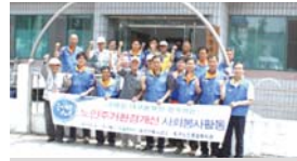
6.19 경로당시설개보수 교래 일대구건축사업소