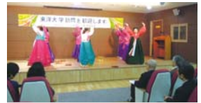
3.27 일본동양대학교 기관방문