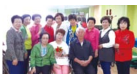
5.15 스승의날 기념행사