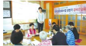
6.25 경로당 상반기 강사간담회