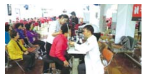
4.24 안질환특강 및 검진