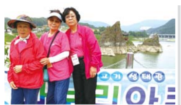
⑥ 도담삼봉 관람

동구노인대학, 사회교육사업, 노인일자리사업, 경로당활성화사업, 봉사단 등 각 분야별 말은바 소임을 다하시는 리더(대표)님의 노고에 감사드리며, 앞으로도 행복하고! 즐겁고! 발전하는! 동구노인종합복지관을 만들어주시길 부탁드립니다^^