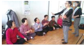
경로당 웃음치료(매주 목·금)