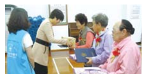
5.8 어버이날 효사랑나눔행사