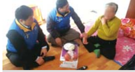
1.28 구정가래떡나누기 행사