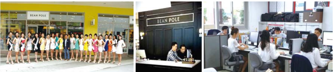
▲ 마이홈에서와는 사뭇 다른 모습으로 업무를 보고 계시네요 ♪