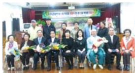
3.31 학생회 이취임식