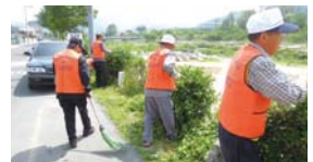
3~6월 아름봉사단 봉사활동