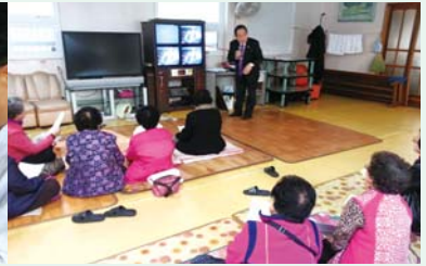
▲ 노래교실 프로그램