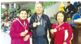
3.29 제24회 대구광역시 연합회 장기생활체육 탁구대회