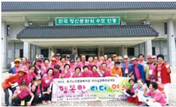
① 안동 민속박물관 관람