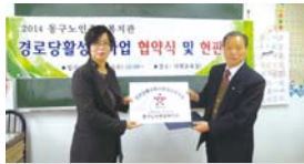
3.12 경로당 협약식