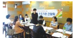
6~7월 일자리수요처 간담회