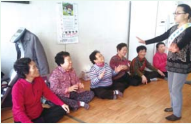
▲ 우울증예방교육 프로그램

동구노인종합복지관에서는 어르신들의 활기찬 경로당 여가문화생활의 영위를 위해 동구지역 내 22개소 경로당을 선정하여 건강증진, 취미, 여가, 특별 프로그램 등으로 찾아가는 서비스 를 제공하고 있습니다.