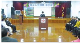
3.3 1학기 개강식