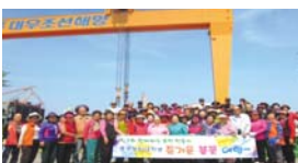
4.15 노인대학 봄나들이