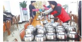
동절기 국전달사업(매주 수요일)