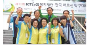
6.16~17 KT&G복지재단 전국 어르신 탁구대회