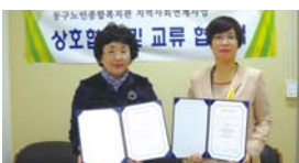
4.30 불로초등학교 MOU체결