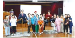
6.26 무중력인간 퍼포먼스공연