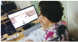
Happy Bean Day(매월15일)