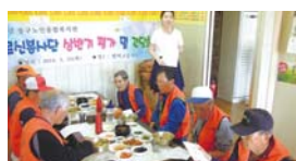
5.15 아름봉사단 상반기평가회