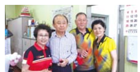
5.21 부부의날 기념이벤트