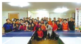
4.9 제10회 핑퐁은 건강을 싣고