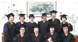
6.28 도시농부학교 1기 졸업식