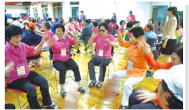
③ 행복한 리더십 교육