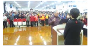
3.4 노인일자리사업 발대식