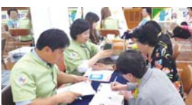
5.15 골밀도, 기초건강검진