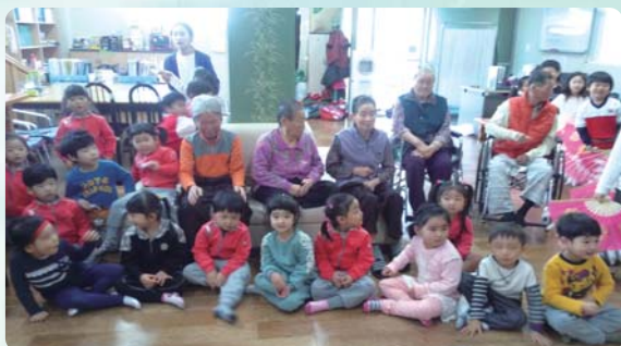
지역사회연계프로그램 - 동촌어린이집 재롱잔치