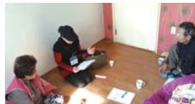
특거노인 우울증예방 상담 프로그램(07월~11월)