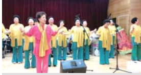
경로가요제 축하 공연(합창반) (10.29)