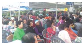
십시일반 나눔 주막촌(10.02)