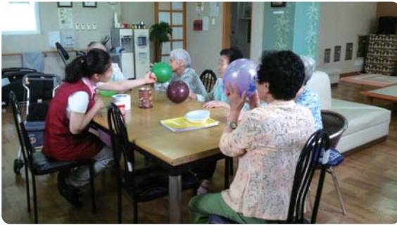
풍선요법 - 얼굴그리기