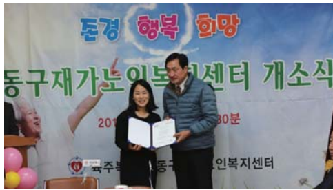
협약식 「DTRO 안심지부」