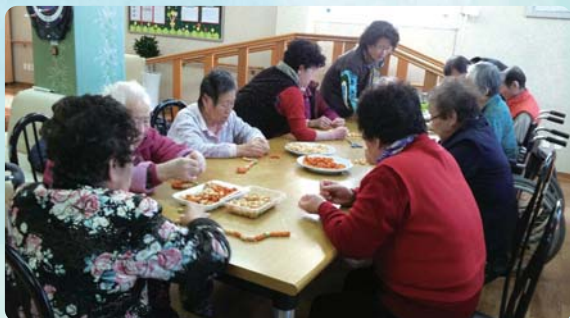
미술활동프로그램 - 과자목걸이