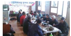
노인일자리사업 참여자 간담회(08.29)