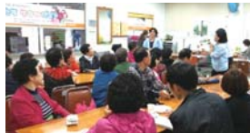
제2회 동구평생학습주인 한병방향제 만들기(10.13)