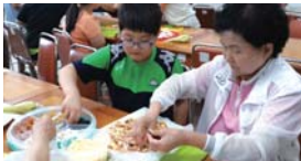
세대공감 프로젝트 피자만들기(07.23)