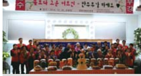
경북지방우정청 지원 동구어르신 생신잔치(10.29)