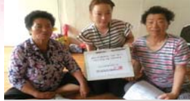
경로당 여름 나기 행사(07.07~07.11)