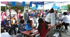
노인의 날 행사(10.02)