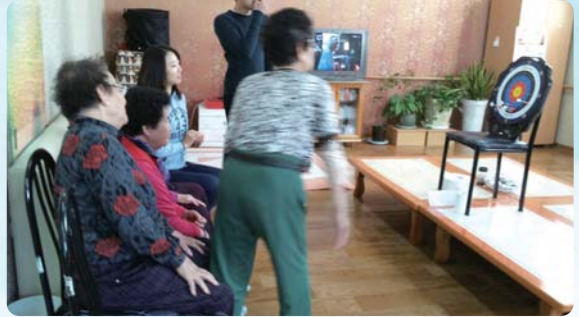
레크리에이션 - 다트놀이