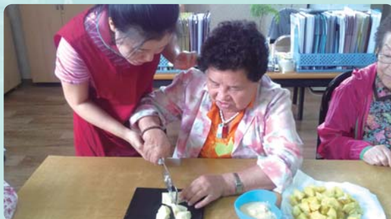
요리활동프로그램 - 고구마 맛탕