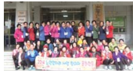
일자리사업 참여자 문화활동(10.22)