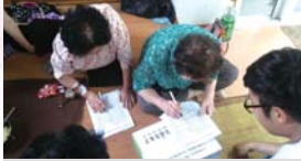
경로당 상반기 설문 조사(07.07~07.11)