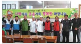
오늘은 짜장면 데이(무료중식)(11.18)