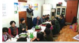
경로당 하반기 임원간담회(12.02)