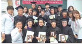
휴대폰 활용교육 졸업(12.11)