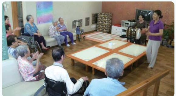
음악활동프로그램 - 장구교실