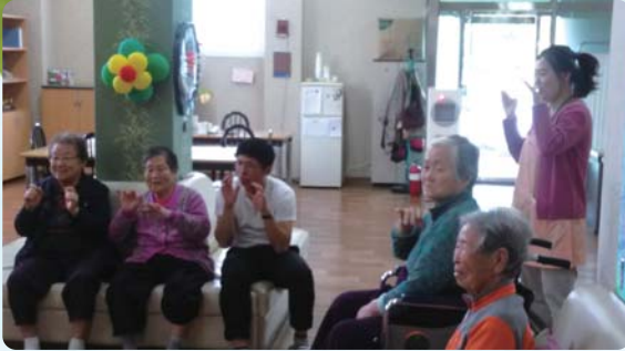
회상활동프로그램 - 전통놀이