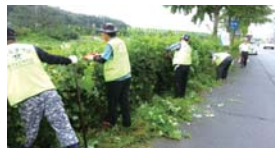
도동 제2경로당 봉사활동(월 1회)