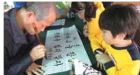
제2회 평생학습박람회 우리집가훈 만들기(10.15)