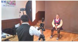
경북지방우정청 지원 장수사진촬영 및 월대영 특강(11.12)