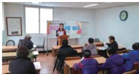
이용자대표 회의(매월 마지막주 수요일)