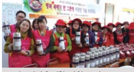
경북지방우정청 지원 특식(11.19)