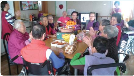
특별행사 - 크리스마스