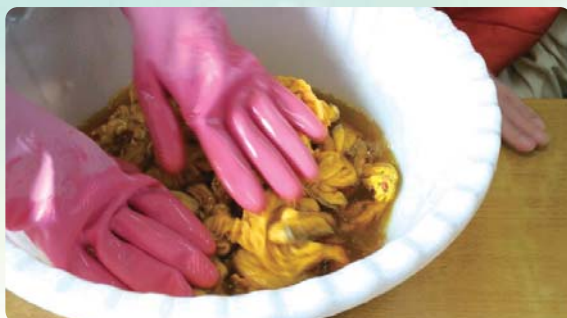
자존감향상프로그램 - 천연염색