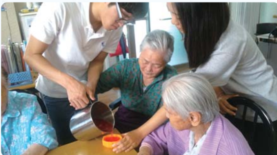
자존감향상프로그램 - 천연비누