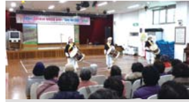
경북지방우정청 지원 문화활동(12.11)