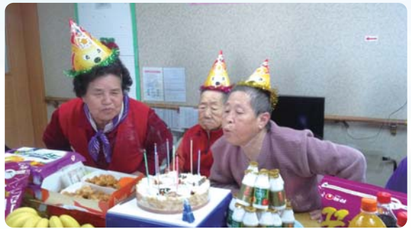
특별행사 - 생신잔치