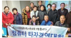
컴퓨터 타자걸어쓰기 타자경연대회(11.17~21)