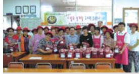
경북지방우정청 지원 특식(07.16)