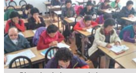
한글반 받아쓰기 대회(11.20)