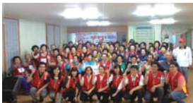
경북지방우정청 지원 웃놀이 한마당(09.03)