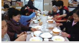
세대공감프로젝트 크리스마스 파티(12.24)