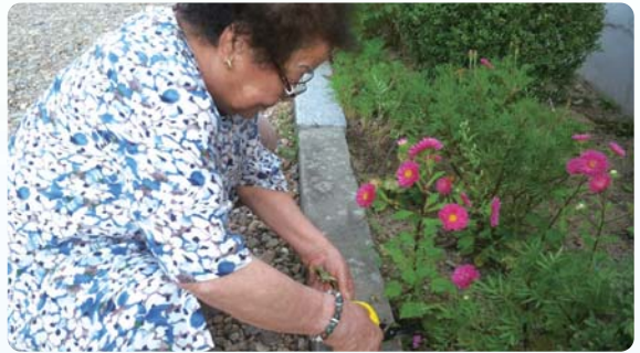
원예활동 - 정원 가꾸기