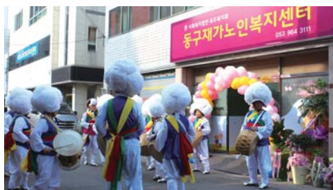
풍물단 거리 행진 「동구노인종합복지관 풍물단」