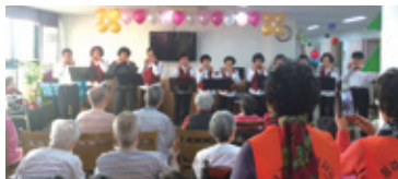
12.22 동구실버하모니카 재능봉사활동