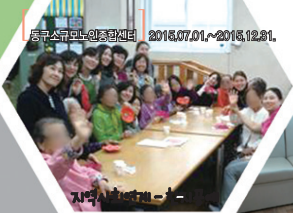
지역사회연계 - 1 -