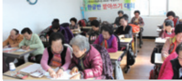
12.3 한글반 받아쓰기대회