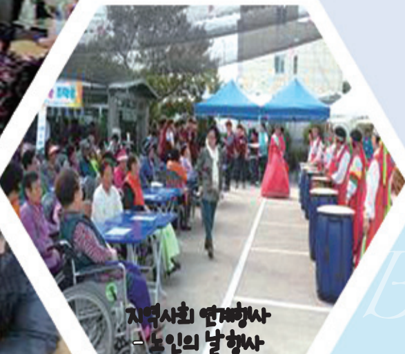
지역사회연계행사 - 노인의 날 행사