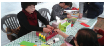
10.17 동구평생학습주간 소원팔찌만들기