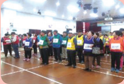
웃이요~모요~웃 놀이 대회 참가자 개회식