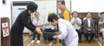
7.24 상장 수여식