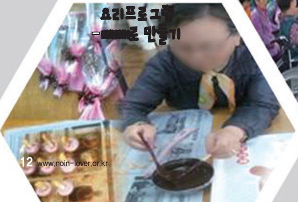
요리프로그램 - 초콜릿 만들기