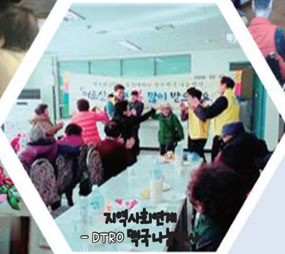
지역사회연계 - DTRO 맥국 나눔 행사