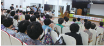
7.23 상반기 운영간담회