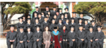
12.31 제13기 수료식