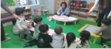
11.24 전통문화 수업