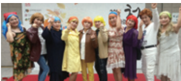
10.20~10.21 두근두근 늦바람 청춘제(연극)