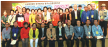
9.16 신입생 환영회