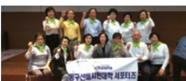
10.27 선배시민대학 서포터즈 단체출범식