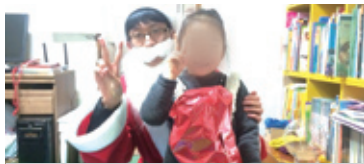
12.24 우리동네산타할아버지 최고