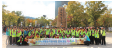
10.16 노노케어 문화활동