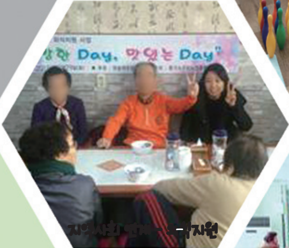
지역사회연계 - 식사지원