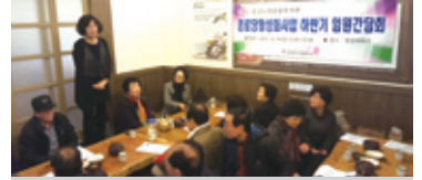
12.4 하반기 경로당 임원 간담회