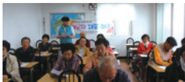
이용자대표회의(매월 마지막주 수요일)