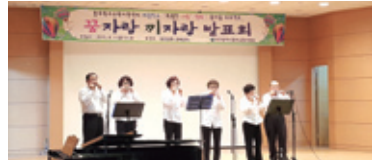
8.7 꿈자랑 끼자랑 발표회(하모니카)