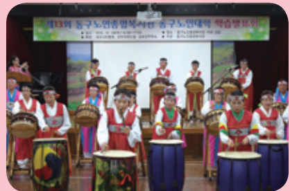
오늘은 내가 난타왕~ 난타반 학습발표회

동구노인대학은 한 해 동안 열심히 갈고 닦은 실력을 뽐내기 위한 장을 마련하기 위해 매년 12월 학습 발표회를 개최하고 있습니다. 동구노인대학 어르신 500여명과 지역주민 100여명이 함께 어우러져 즐거운 추억을 만들었습니다. 오카리나 연주, 풍물 공연, 연극공연 등 어르신들이 밤을 새며 준비한 공연 관람뿐만 아니라 지역사회 내 경로당의 축하공연까지 다양한 볼거리로 가득한 즐거운 하루를 보냈습니다.