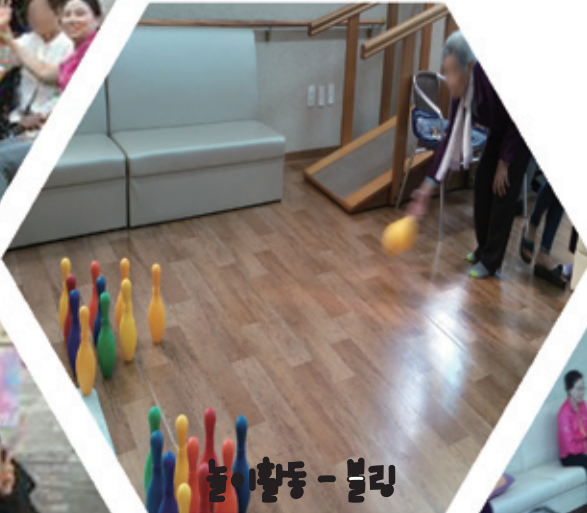
놀이활동 - 볼링