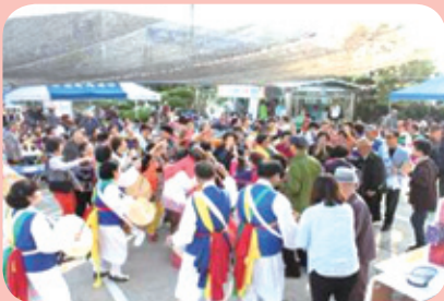
열씨구나~종대방 한바탕 놀아보는 노인의 날 한바탕