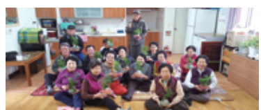
11.12 나만의 버킷(bucket)만들기