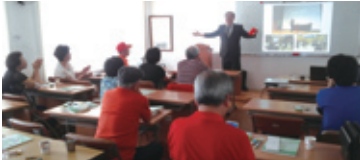
7.29 선배시민양성 프로그램 교육