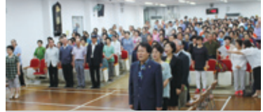
7.24 1학기 종강식