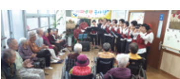
11.18 재능나눔봉사단 봉사활동