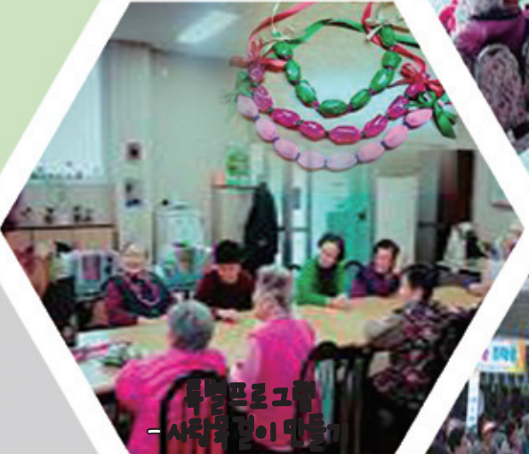
특별프로그램 - 사랑꽃 만들기