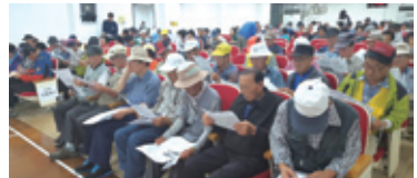
9.30 공익형 참여자 간담회