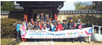
10.15 교육형 문화활동