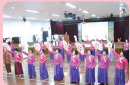
부채꽃이 활짝~ 우리춤 학습발표회

동구노인대학은 한 해 동안 열심히 갈고 닦은 실력을 뽐내기 위한 장을 마련하기 위해 매년 12월 학습 발표회를 개최하고 있습니다. 동구노인대학 어르신 500여명과 지역주민 100여명이 함께 어우러져 즐거운 추억을 만들었습니다. 오카리나 연주, 풍물 공연, 연극공연 등 어르신들이 밤을 새며 준비한 공연 관람뿐만 아니라 지역사회 내 경로당의 축하공연까지 다양한 볼거리로 가득한 즐거운 하루를 보냈습니다.